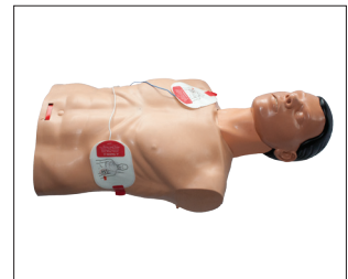
Plaatsen van de AED pads