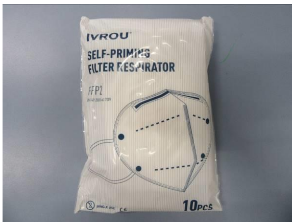
Verpackung / Packaging