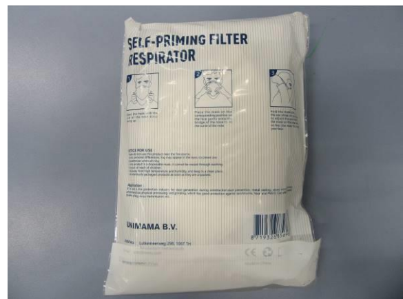
Innere Verpackung / Inner Packaging