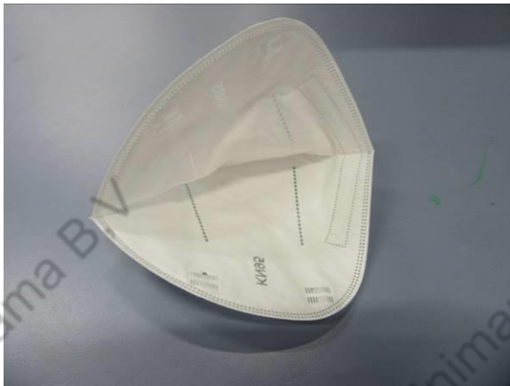
Innenansicht / Inner view