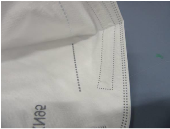
Nasenbügel / Nose clip