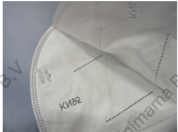
Innenansicht / Inner view