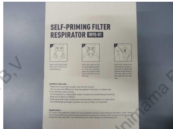
Verpackung / Packaging