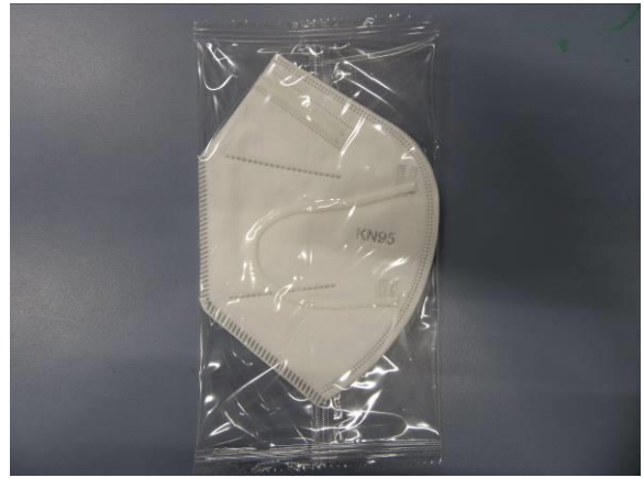
Seitenansicht / Side view